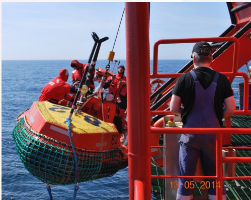
FRBén på vej i "baljen" efter en person (øvelse)

skib i 7 dage om bord, og hvordan skibsassistenterne (befarne og ubefarne) og officerne udførte deres job. Pludselig før middag en dag kom "mand over bord" signalet, og 30-45 sek. senere var tre personer i FRBén. Spændende var det at se, hvor hurtigt en FRB er i vandet og en "person" (bøjle) samlet op langt fra skibet. Besætningen var ombord igen inden 4 minutter. Jeg var ude at sejle i FRB'en hver