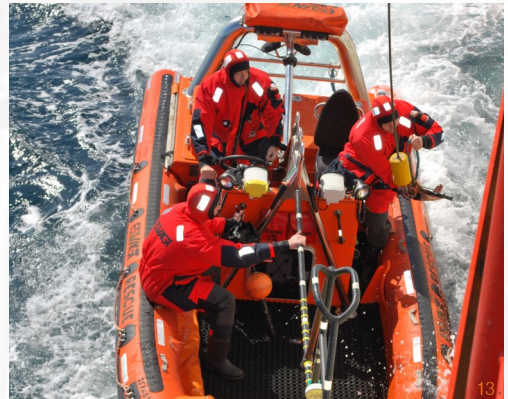
FRBén hejses op med en "reddet person (orange bøjle)".