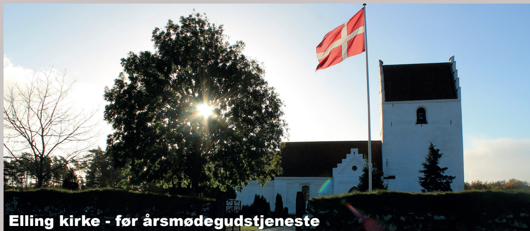
Elling kirke - før årsmødegudstjeneste