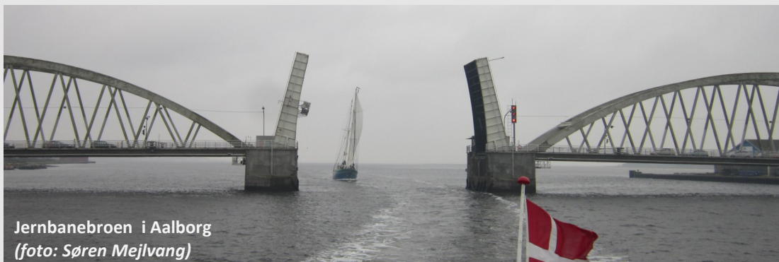
Jernbanebroen i Aalborg