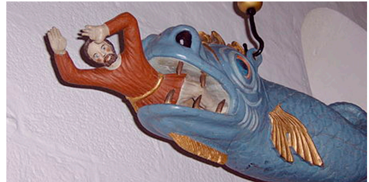
Hængefigur i Hvidbjerg kirke