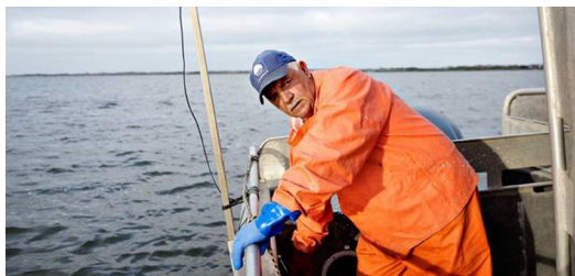
også blevet fiskere.