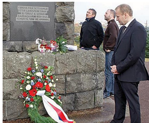
Lagmanden lægger krans ved mindesmærket i Tórshavn.

I domkirken i Tórshavn bliver der ligeledes hver 1. nov. holdt mindegudstjeneste. Denne gudstjeneste bliver sendt direkte på den færøske radio.