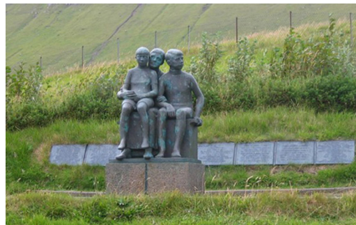
Mindesmærket i Gjógv.